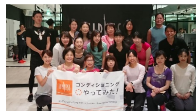
1/19(土)アンバサダーミーティングの様子 ~カラダにいいことはじめよう~