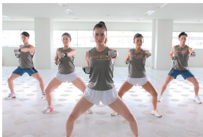
MOVE BODY FIGHT

関東・関西・東海地区を中心に総合フィットネスクラブおよび 24 時間トレーニングジムを展開する株式会社ティップネス（本部：東京都港区、代表取締役社長：酒巻 和也）は、オリジナルの新シリーズとなるスタジオレッスンプログラム『MOVE BODY FIGHT』および『MOVE BODY POWER』を、ティップネス各店にて、2021 年 10 月 1 日より順次スタートします。