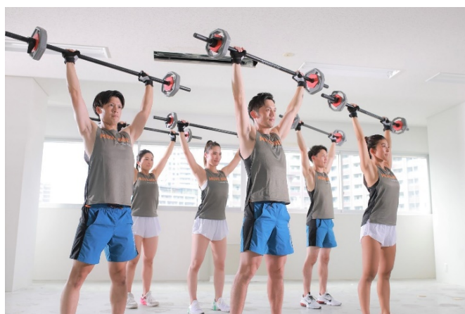
MOVE BODY POWER