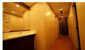
更衣室・男女別トイレ