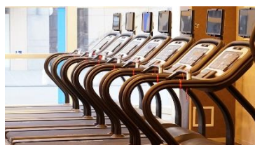
カーディオ（有酸素）エリア

また、これだけの充実度でありながら、月会費は税込み3,278円〜とライトに始めていただけるリーズナブルラインを実現しました。混雑によるストレスのない快適な施設と、始めやすく続けやすい月会費で、地域にお住まいの方々のウェルネスライフを強力にサポートしてまいります。