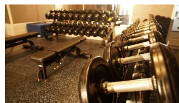
フリーウエイトエリア②